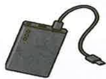
モバイル バッテリー